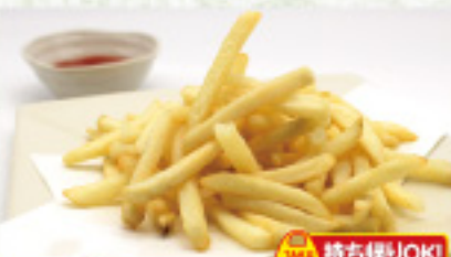
食券 21 フライドポテト 450円