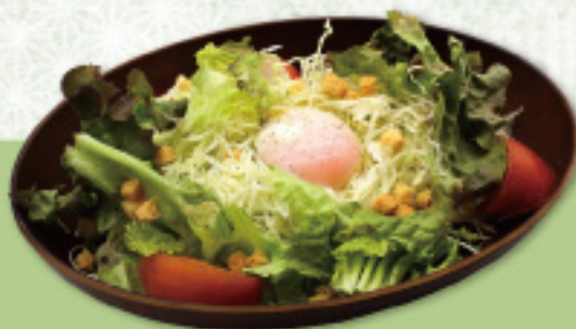
食券 20 ゆららサラダ 半熟卵のシーザーサラダ 480円