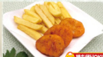
食券 24 ポテトおナゲット 500円