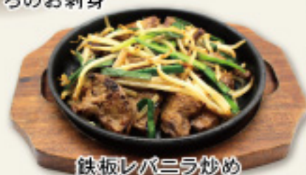
鉄板レバニラ炒め