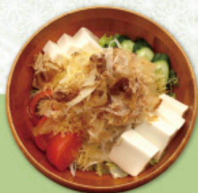
食券 20 ゆららサラダ 豆腐のバリバリサラダ 480円