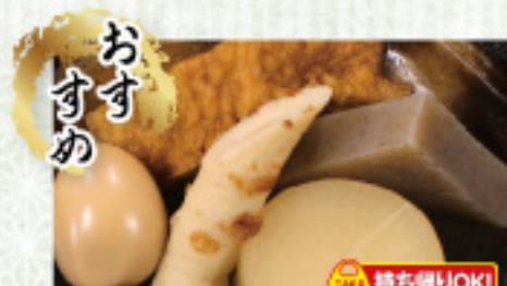
食券 金券 自家製おでん 全品 100円