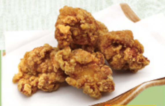
食券 23 特製 鶏唐揚げ 600円