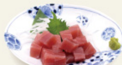
ぶつ切りまぐろのお刺身