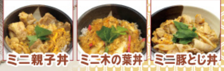
ミニ親子丼 ミニ木の葉丼 ミニ豚とじ丼