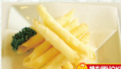
食券 22 チーズカリカリ 500円