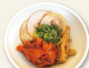
おつまみ三種盛り (チャーシュー・キムチ・メンマ)