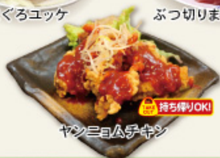
ヤシニヨムチキン